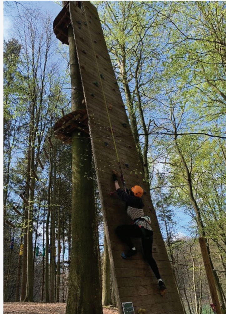
Situationsbillede - Skovtårnet/Camp Adventure med kursister fra VUC.

Styrke elevens tilhørsforhold til skolen via fællesskab og at støtte elever, hvor der ikke er mulighed for at søge SPS.