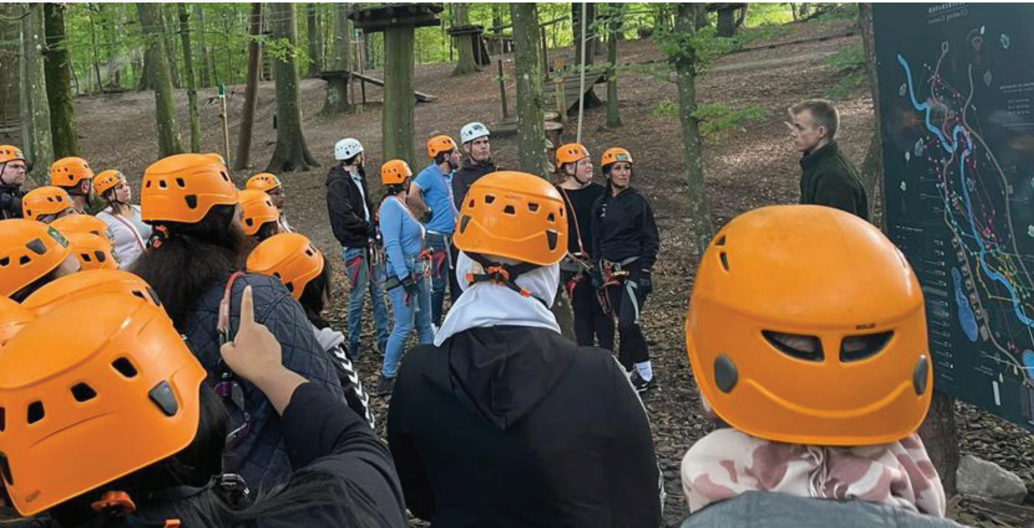
Koncentrerede kursister - Camp Adventure med kursister fra VUC.