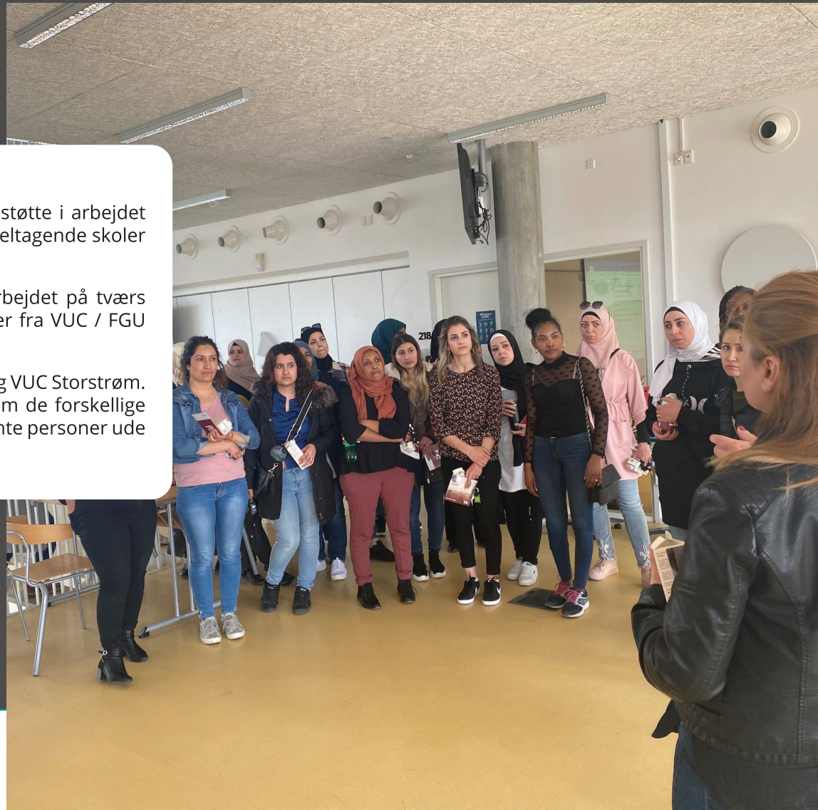
VUC-kursister på besøg på ZBC – Indikator: Overgangen fra VUC til erhvervsuddannelserne

Partnere i projektet var Regions Sjællands erhvervsskoler og VUC Storstrøm. Hvis man ønsker yderligere information, og/eller dialog om de forskellige udviklede aktiviteter, fremgår kontaktoplysninger til relevante personer ude på skolerne sidst i denne publikation.